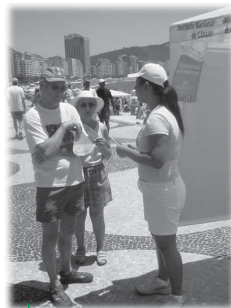
Em Copacabana, foram distribuídos folhetos para a população.

Além disso, o aeroporto Santos Dumont, a Infraero e as empresas Auto Viação 1001, Varig/Fundação Ruben Berta, o Hotel Marina e a concessionária da Ponte Rio-Niterói S/A se engajaram na iniciativa e têm distribuído para seus clientes milhares de folhetos informativos. O Corpo de Bombeiros Militar do Estado do Rio de Janeiro também divulgará o material da