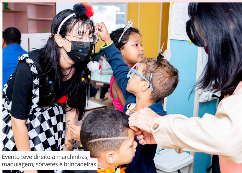
Evento teve direito a marchinhas, maquiagem, sorvetes e brincadeiras