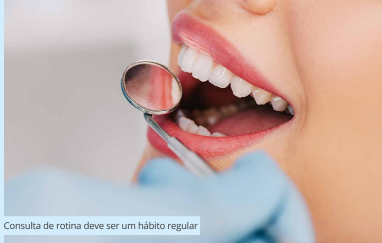
Consulta de rotina deve ser um hábito regular

Alimentos e bebidas que são escuros por natureza, como mate e café, por exemplo, são tão nocivos quanto