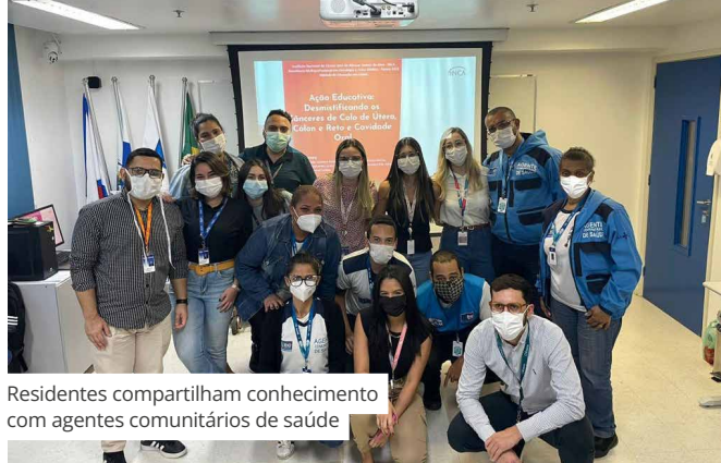
Residentes compartilham conhecimento com agentes comunitários de saúde

Com base no aporte teórico oferecido, os residentes compartilham experiências com agentes comunitários de saúde e conhecem um pouco mais sobre a realidade dos territórios onde eles atuam. “A proposta exige trabalho em equipe, é desafiadora e envolve um esforço grande de planejamento, tanto dos alunos quanto de todo o grupo envolvido na condução do módulo. No final, os resultados