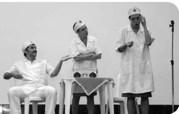
Atores interpretaram profissionais de saúde e divertiram a todos