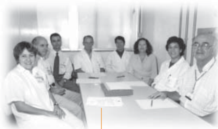
O Núcleo é formado por profissionais das áreas de pesquisa, assistência, estatística e epidemiologia.

aplicada e ainda organiza eventos para promover o conhecimento científico dos profissionais. Em virtude do interesse criado pelo Curso de Epidemiologia e Estatística Aplicada à Oncologia, que reuniu médicos, dentistas e enfermeiros do INCA, deverá ser realizado um outro curso, com a participação de palestrantes externos, no segundo semestre. Além disso, entre os dias 19 e 20 de abril, o NDTT organizou, em conjunto com a Seção de Tecido Ósseo e Conectivo, a Jornada de Tumores Ósseos. ■