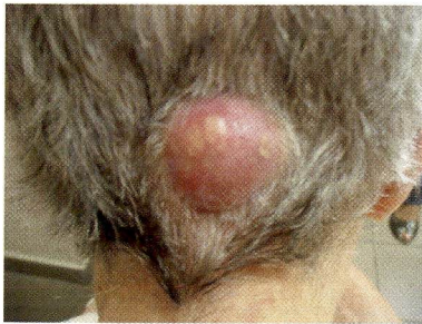
Figura 2 – Ferida tumoral estadiamento 1N

Ferida fechada ou com abertura superficial por orifício de drenagem de exsudato límpido, de coloração amarelada ou de aspecto purulento. Tecido avermelhado ou violáceo, ferida seca ou úmida. Dor ou prurido ocasionais. Sem odor.