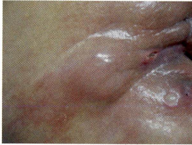
Figura 1 – Ferida tumoral estadiamento 1

Pele íntegra. Tecido de coloração avermelhada ou violácea. Nódulo visível e delimitado. Assintomático.