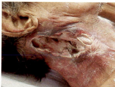
Figura 5 – Ferida tumoral estadiamento 4

Ferida invadindo profundas estruturas anatômicas. Profundidade expressiva. Por vezes, não se visualiza seu limite. Em alguns casos, com exsudato abundante, odor fétido e dor. Tecido de coloração avermelhada ou violácea, porém o leito da ferida encontra-se predominantemente de coloração amarelada.