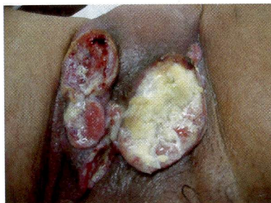
Figura 4 – Ferida tumoral estadiamento 3

Ferida espessa envolvendo o tecido subcutâneo. Profundidade regular, com saliência e formação irregular. Características: friável, ulcerada ou vegetativa, podendo apresentar tecido necrótico liquefeito ou sólido e aderido, odor fétido, exsudato. Lesões satélites em risco de ruptura. Tecido de coloração avermelhada ou violácea, porém o leito da ferida encontra-se predominantemente de coloração amarelada.