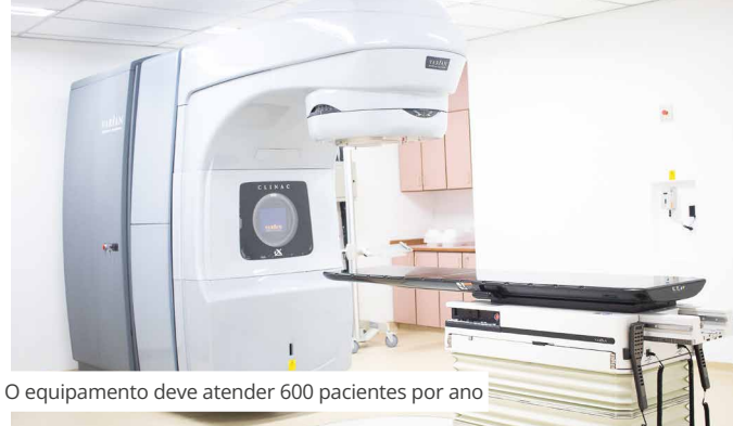
O equipamento deve atender 600 pacientes por ano

O antigo acelerador linear, que estava no fim de sua vida útil, foi desativado no final de 2021, para execução de obras de adequação do espaço. Desde então, os pacientes são encaminhados, pela regulação estadual, para realização de radioterapia em outras unidades de saúde.