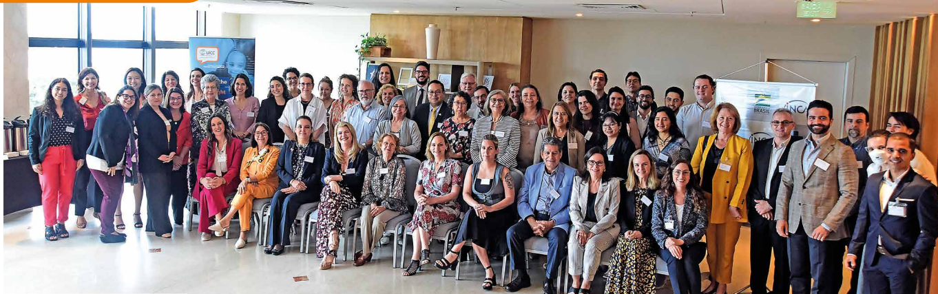
Participantes debateram sobre cânceres femininos na América Latina