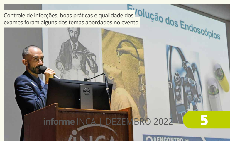
Controle de infecções, boas práticas e qualidade dos exames foram alguns dos temas abordados no evento