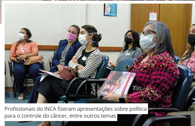
Profissionais do INCA fizeram apresentações sobre política para o controle do câncer, entre outros temas