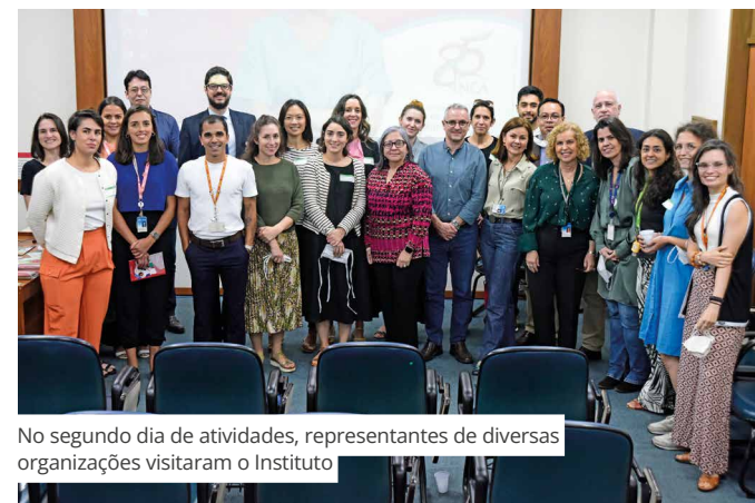
No segundo dia de atividades, representantes de diversas organizações visitaram o Instituto

desta magnitude contribui para reforçar a atuação do INCA como um parceiro internacional nas ações de controle do câncer e permite que instituições e organizações de outros países conheçam as iniciativas desenvolvidas pelo Instituto, de modo a construir projetos de cooperação técnica entre elas e a instituição.