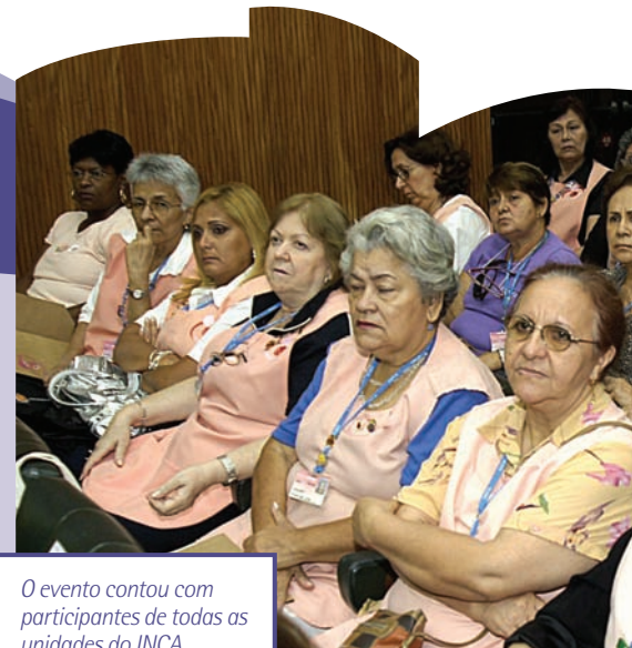
O evento contou com participantes de todas as unidades do INCA