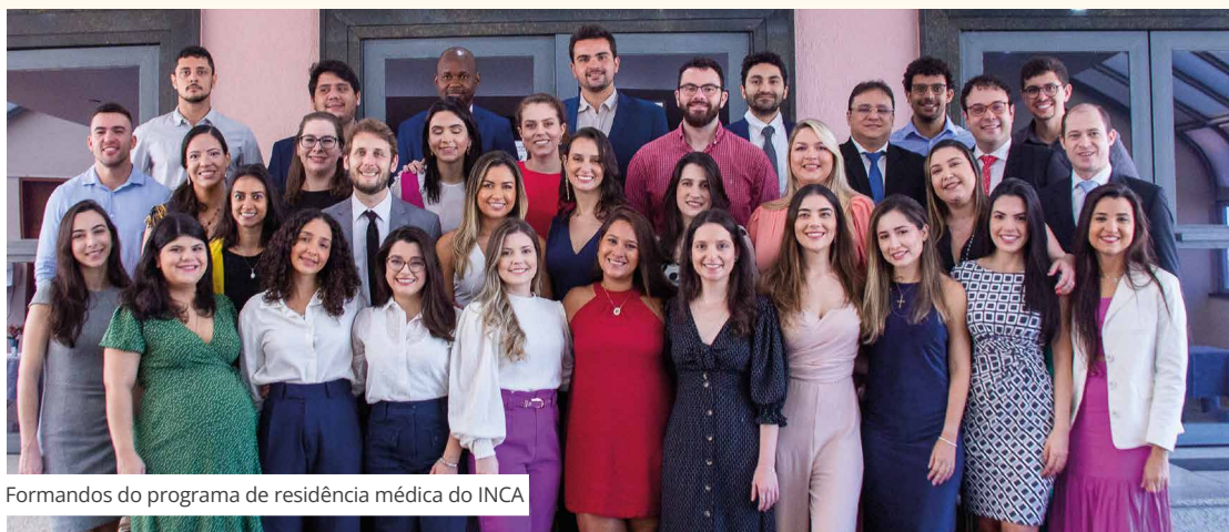
Formandos do programa de residência médica do INCA

No dia 27 de janeiro, no anfiteatro do prédio-sede, ocorreu a cerimônia de formatura da residência médica. Ao todo, 48 alunos concluíram os programas nas seguintes áreas: anestesiologia, cirurgia de cabeça e pescoço, oncologia clínica, cirurgia de cabeça e pescoço de grande porte, cirurgia plástica, hematologia e hemoterapia, mastologia, radiologia e diagnóstico por imagem, endoscopia, terapia intensiva pediátrica e medicina do trabalho.