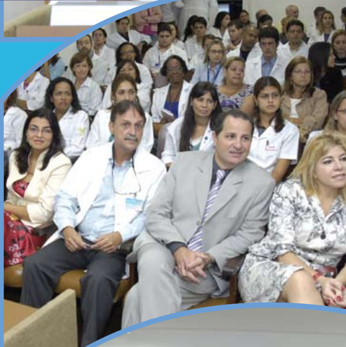
... que lotaram o auditório da unidade para assistir às palestras