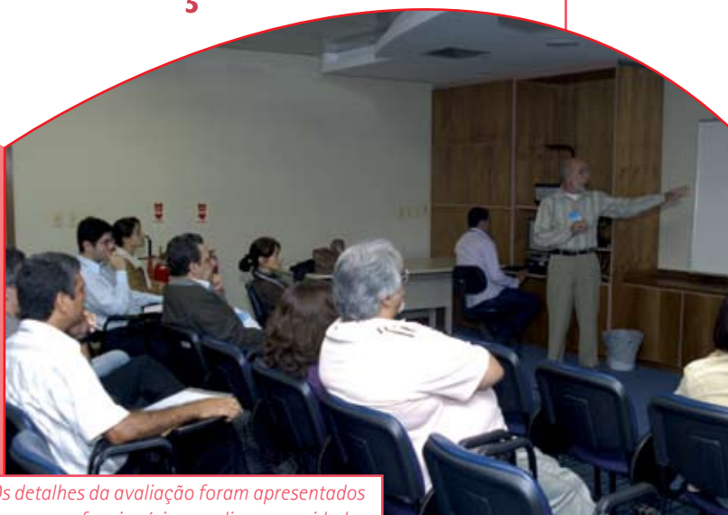
Os detalhes da avaliação foram apresentados aos funcionários em diversas unidades

A avaliação de desempenho profissional tem como objetivos fornecer subsídios para a gestão da política de recursos humanos; verificar as neces-