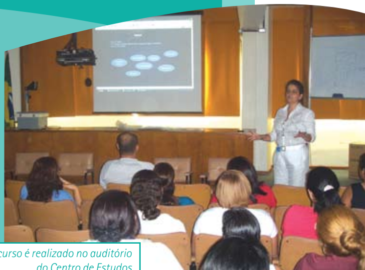
O curso é realizado no auditório do Centro de Estudos