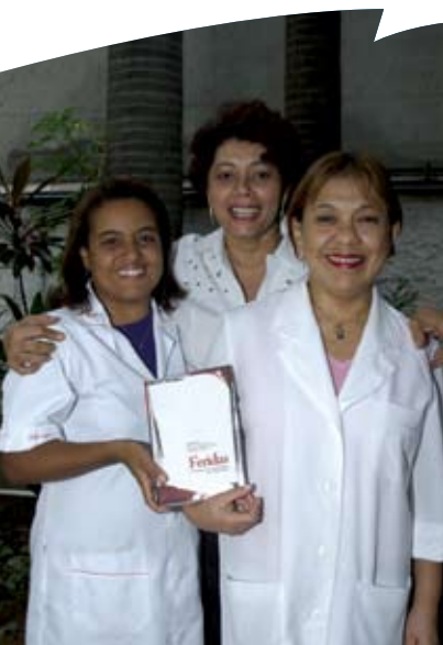
As profissionais se inspiraram na experiência adquirida no INCA para contribuir com a publicação