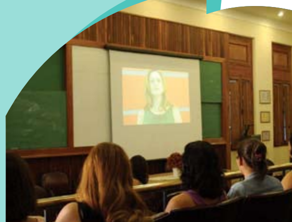
Os novos servidores assistiram a um vídeo sobre a estrutura e o trabalho desenvolvido pelo INCA