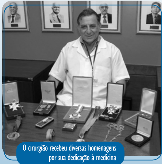
O cirurgião recebeu diversas homenagens por sua dedicação à medicina