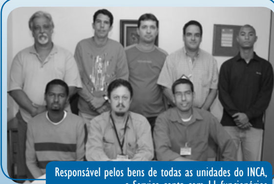
Responsável pelos bens de todas as unidades do INCA, o Serviço conta com 11 funcionários

Registrar as incorporações através de compras ou doações; promover o tombamento; registrar a localização; atribuir aos funcionários a responsabilidade pelo uso e guarda dos bens; emitir e atualizar os termos de responsabilidade; controlar e registrar a movimentação; verificar itens extraviados ou danificados e abrir processos administrativos; abrir processo de alienação; registrar as baixas e verificar a existência dos materiais através de inven-