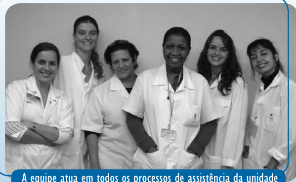
A equipe atua em todos os processos de assistência da unidade

A equipe atua em todos os processos de assistência do HC IV: na área de Ambulatório, fornece apoio psicológico aos pacientes de primeira vez e aos seus familiares, de acordo com a sua demanda e a avaliação do profissional. Também é disponibilizado o acompanhamento subsequente. Na Internação Hospitalar, o atendimento é individual, por leito, e semanalmente o grupo realiza reuniões para acompanhantes. O grupo também participa, com médicos e assistente social, das reuniões de família todas as quintas-feiras,