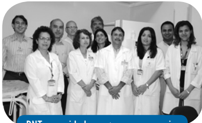
BNT na unidade contou com o apoio do corpo clínico e da Pesquisa Clínica

O Banco Nacional de Tumores e DNA (BNT) anunciou a inclusão de pacientes do HC III para coleta de tumores de mama. A iniciativa de recolher doações de amostras dos tecidos tumorais das pacientes tratadas no HC III contou com o apoio do corpo clínico e da Pesquisa Clínica da unidade.