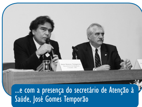
...e com a presença do secretário de Atenção à Saúde, José Gomes Temporão

O secretário de Atenção à Saúde, José Gomes Temporão, que também participou da cerimônia, parabenizou a iniciativa do INCA e afirmou que a publicação cumpre uma missão muito importante: "É um documento didático que auxiliará no dia-a-dia dos gestores, estudantes e profissionais da área de saúde. Os dados estão expostos claramente". Temporão alertou que as entidades do poder público têm uma função importante em relação à comunicação adequada de informações sobre o câncer.