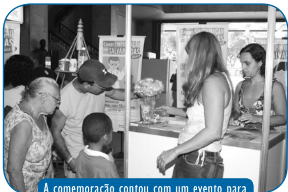
A comemoração contou com um evento para a população na Central do Brasil...

Câncer: A informação pode salvar vidas. Este foi o tema do Dia Nacional de Combate ao Câncer, comemorado no dia 27 de novembro. Para celebrar a data este ano, foi lançada a nova publicação do Instituto, Situação do Câncer no Brasil, uma análise comentada da doença no país, e promovido um evento para a população na Central do Brasil.