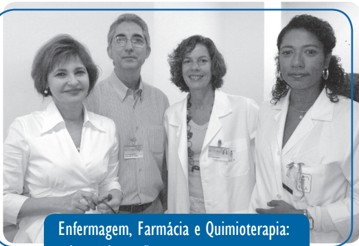
Enfermagem, Farmácia e Quimioterapia: relação de confiança

O gerenciamento do Setor de Preparo de Antineoplásicos do HC I agora é da responsabilidade da Seção de Farmácia. Anteriormente, a função era desempenhada pela Divisão de Enfermagem. A transição foi marcada com um café da manhã no dia 4 de dezembro, no 7º andar do HC I. A implantação do novo processo foi possível graças à contratação de novos profissionais por concurso.