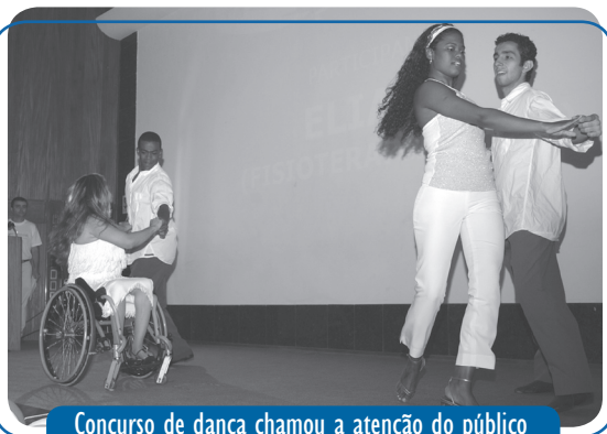
Concurso de dança chamou a atenção do público

Concurso de dança entre os funcionários e de decoração natalina dos setores, caricaturista e distribuição de chocolate. Estas foram algumas das novidades da Festa de Fim de Ano dos funcionários do INCA, organizada pela Divisão de Comunicação Social, que aconteceu dia 22 de dezembro, no auditório do 8º andar do prédio da Praça Cruz Vermelha.