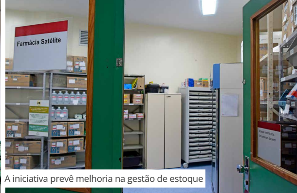
A iniciativa prevê melhoria na gestão de estoque