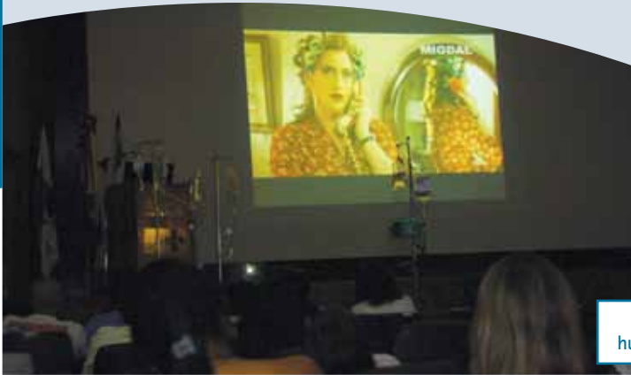
A personagem Dona Hermínia é vivida pelo ator e humorista Paulo Gustavo, um dos roteiristas do longa

Para comemorar os 10 anos da Área de Ações Voluntárias do INCA (INCAvoluntário), completados em 2013, foi realizada, no dia 13 de junho, uma exibição exclusiva do filme Minha mãe é uma peça . Pacientes e funcionários do Instituto se divertiram com as histórias da personagem Dona Hermínia – vivida pelo ator e humorista Paulo Gustavo – em um telão no auditório Moacyr Santos Silva.