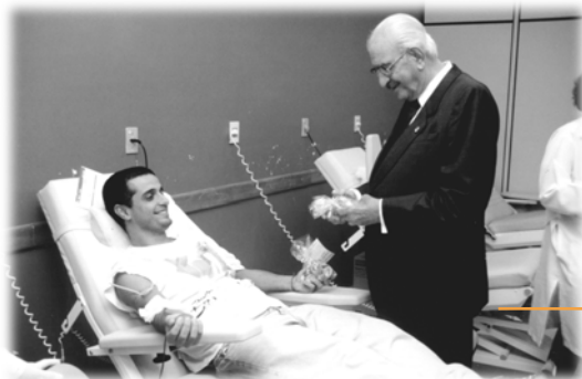
Jamil Haddad distribuiu chocolates a doadores de sangue.

bombons e o agradecimento de toda a equipe, em 16 de abril. O Diretor Geral do INCA, Jamil Haddad, juntou-se a estes profissionais e entregou chocolates a doadores, na sala de coleta de sangue, localizada no 2º andar do HC I.