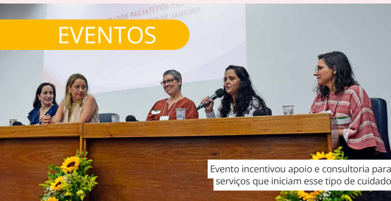
Evento incentivou apoio e consultoria para serviços que iniciam esse tipo de cuidado