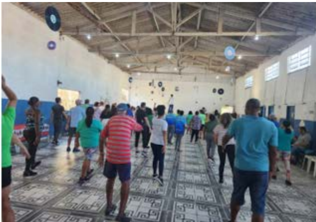
Figura 1 – Participantes de atividade realizada em São Vicente/SP (2023) em alusão ao mês da prevenção de câncer de intestino

A Área Técnica de Alimentação, Nutrição, Atividade Física e Câncer (ATANAF/Conprev/INCA) recebeu 14 relatos de ações realizadas em alusão ao mês da prevenção de câncer de intestino. Foram realizadas em Minas Gerais, São Paulo e Rio Grande do Sul, com público-alvo como usuários na fila de espera dos serviços de saúde, escolares atendidos pelo Programa Saúde na Escola (PSE), trabalhadores da limpeza urbana e até mesmo profissionais da saúde: enfermeiros, técnicos de enfermagem, nutricionistas e psicólogos. Foram relatadas ações desenvolvidas em unidades básicas e mistas de saúde, nas da Saúde da Família, escola, faculdade, hospital e no almoxarifado de uma unidade da gestão pública municipal, entre outros locais.