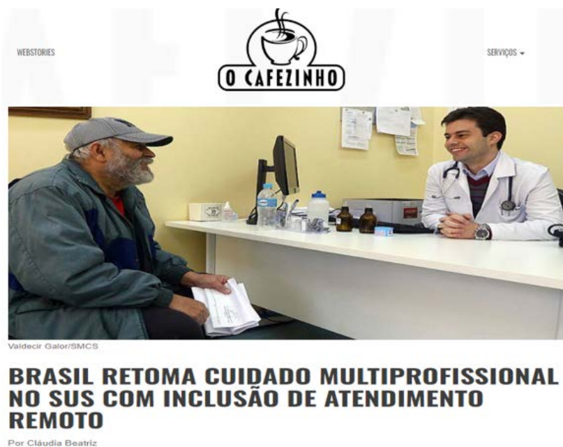
Figura 4 – Brasil retoma cuidado multiprofissional no Sistema Único de Saúde, com inclusão de atendimento remoto