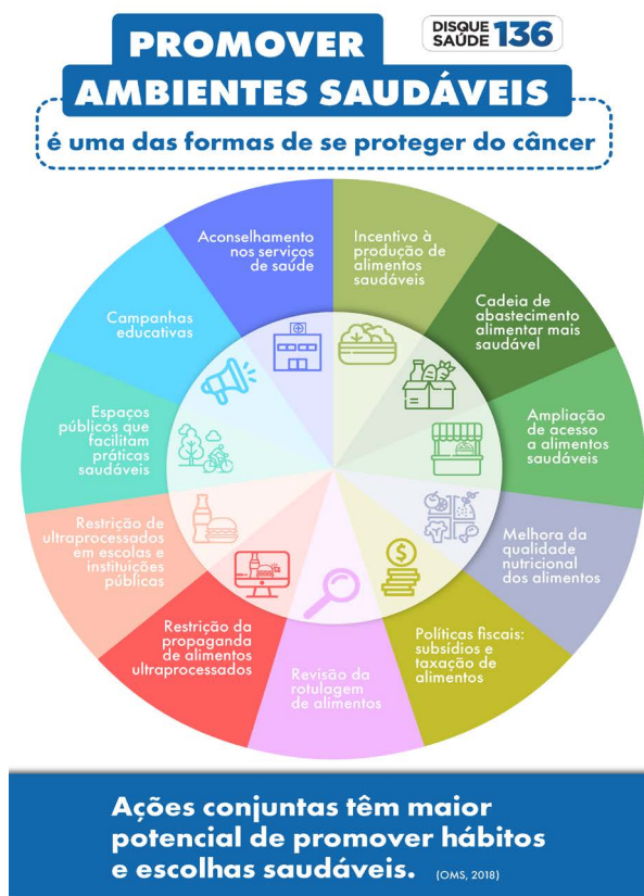
Figura 6 – Promover ambientes saudáveis é uma das formas de se proteger do câncer

Acesse: gov.br/inca/pt-br/assuntos/causas-e-prevencao-do-cancer/alimentacao