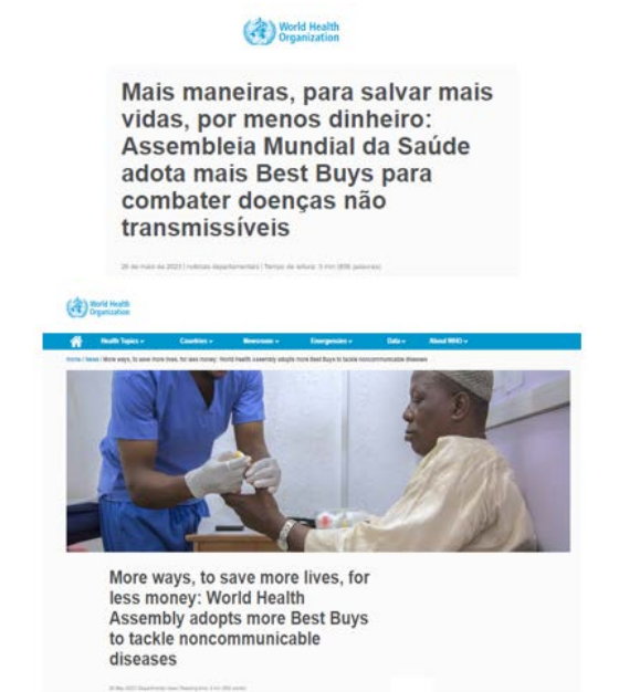
Figura 5 – OMS – mais maneiras para salvar mais vidas, por menos dinheiro: Assembleia Mundial da Saúde adota mais best buys para combater doenças não transmissíveis