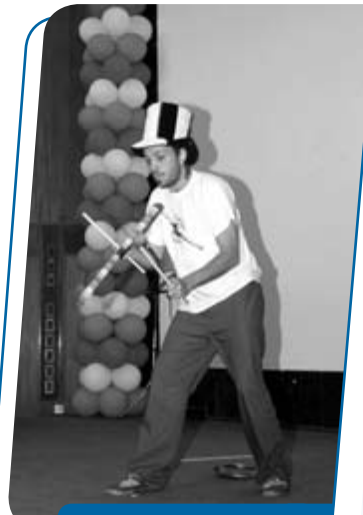
... e o quadro Se vira no INCA