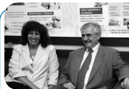
Jandira Feghali conheceu a Pesquisa e o CEMO acompanhada pelo diretor geral do INCA