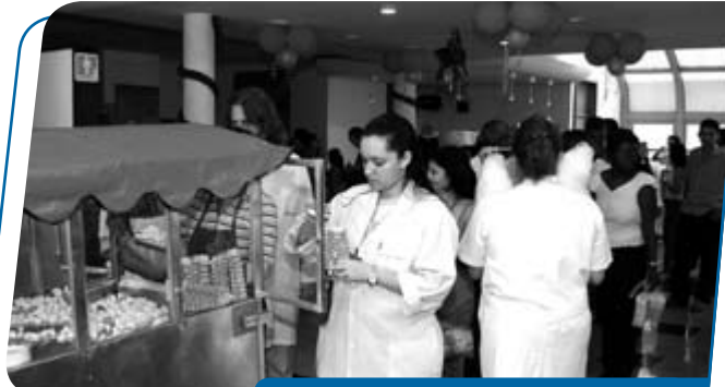
A festa contou com novidades como a distribuição de pipoca...

O evento foi encerrado com o sorteio de presentes. O item mais cobiçado deste ano foi um computador, além de televisão tela plana, aparelho de DVD, forno microondas e ar-condicionado, entre outros. Após a festa, os funcionários puderam desfrutar do tradicional almoço no refeitório do 5º andar, que ofereceu um cardápio tipicamente natalino.