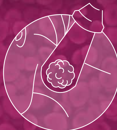
Depois de cinco minutos, aplicação do laser