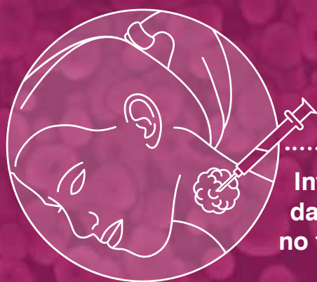
Introdução da cisplatina no tumor

A grande inovação no tratamento brasileiro é que ele foi aperfeiçoado com aplicação de injeções intratumorais de quimioterapia. A combinação da LITT com a cisplatina foi proposta no início dos anos 2000, quando o cirurgião tornou-se diretor do programa de laser-quimioterapia da UCLA. “Observamos que o