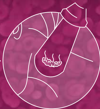
Fotoevaporação do fluido intracelular

Por enquanto, a nova terapia está sendo administrada somente no hospital da Unifesp, embora várias universidades já utilizem o equipamento de laser para o tratamento de outros tipos de tumores sólidos, como mama, pulmão e próstata. “É preciso que os cirurgiões especialistas em cabeça e pescoço conheçam a técnica e se capacitem”, avalia Paiva. A capacitação aos profissionais interessados poderá ser disponibilizada pelo Programa de Pós-Graduação do Departamento de Otorrinolaringologia e Cirurgia de Cabeça e Pescoço da Unifesp. ■