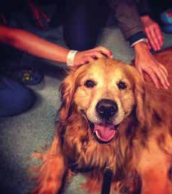
Alta demanda: os animais do Instituto Cão Terapeuta participam de quase 300 atendimentos mensais