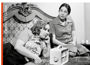
1977 Cotinha ( Sem Lenço, Sem Documento ): trabalho marcante

O último trabalho de Ilva na telinha foi no re-make de Saramandaia , em 2013. Logo depois, soube que estava com câncer. “Eu não pedi demissão, apenas optei por não renovar o contrato. Não achei justo, porque sabia que iria parar para me cuidar, entrar em tratamento. Tem gente que faz isso, mesmo sabendo que não pode trabalhar, só para a empresa pagar os custos de hospital, mas eu não me sentiria bem assim. A Globo nem soube que eu estava doente”, conta. ■