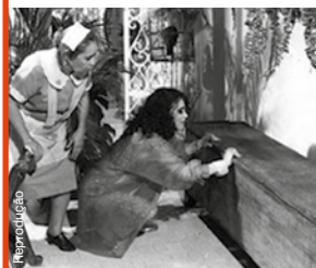
2009 Ernestina ( Cama de Gato ): papel de doméstica reprisado