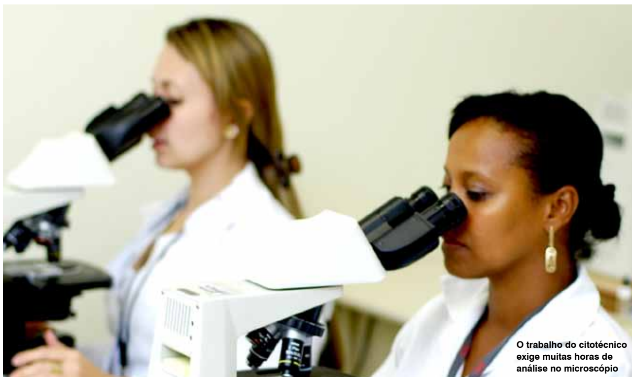
O trabalho do citotécnico exige muitas horas de análise no microscópio