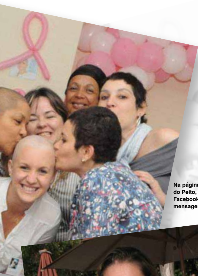
Na página Amigas do Peito, no Facebook, fotos e mensagens positivas