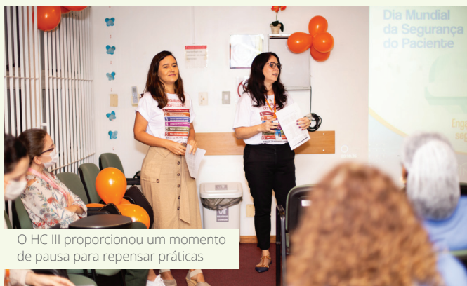
O HC III proporcionou um momento de pausa para repensar práticas