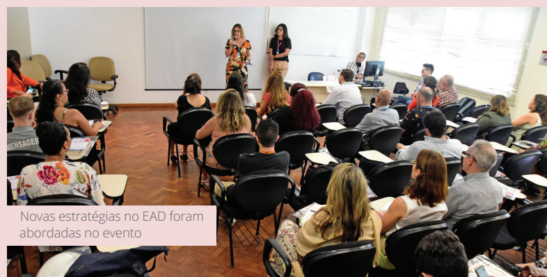
Novas estratégias no EAD foram abordadas no evento

O INCA capacita anualmente por meio de EAD mais de 1.200 pessoas de todo o País e do exterior. A intenção é democratizar o acesso ao ensino, vencendo barreiras geográficas, temporais e financeiras.