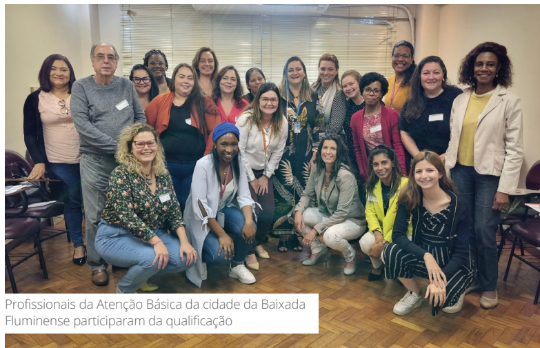
Profissionais da Atenção Básica da cidade da Baixada Fluminense participaram da qualificação