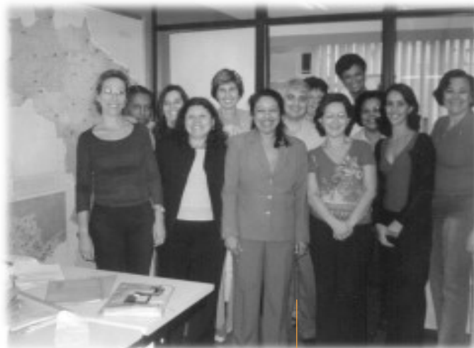
A equipe do Expande acompanha as atividades assistenciais dos CACON na fase inicial.

Um bom exemplo dos benefícios que um CACON pode gerar localmente é o caso de Araguaína, “Hoje, a maioria dos pacientes não precisa mais ser transferida para outras unidades, o que diminuiu o custo operacional no município”, diz o coordenador da Unidade de Radioterapia do