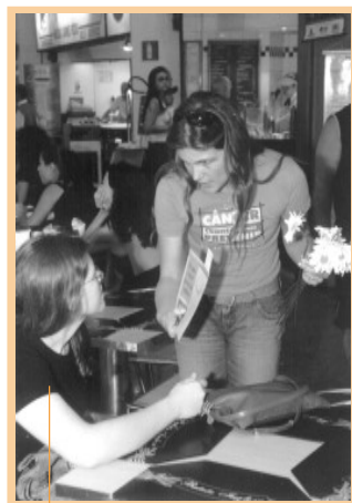
A atriz Cristiana Oliveira mostrou-se uma importante aliada da campanha.

Durante todo o dia 27, artistas e voluntários do INCA distribuíram margaridas e folhetos sobre prevenção do câncer em locais de grande circulação da cidade do Rio de Janeiro: shoppings Rio Sul, Norte Shopping, Plaza Niterói e Nova América; estações do metrô Carioca, Cinelândia, Saens Pena, Pavuna, Estácio e Siqueira Campos; além do calçadão em Nova Iguaçu e Praça Cruz Vermelha. A atriz Cristiana Oliveira movimentou o shopping Rio Sul: “Como formadora de opinião tenho a obrigação de participar de campanhas educativas como esta do INCA”, disse a atriz, que perdeu uma irmã com linfoma. A atriz Zezé Polessa também possui uma irmã que teve câncer de mama, mas, graças à detecção precoce, conseguiu controlar a doença.