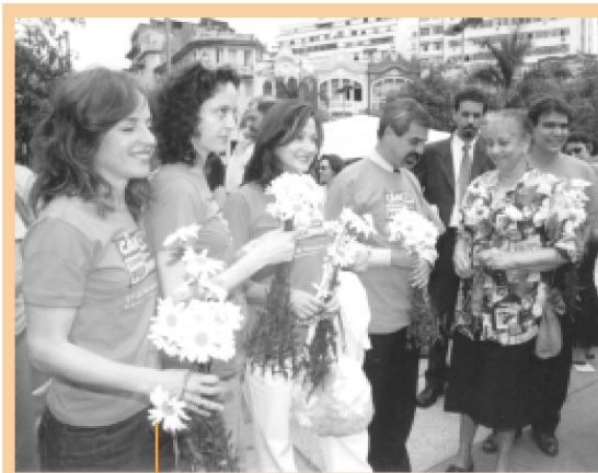
Diversos pontos do Rio, como a Praça Cruz Vermelha, tornaram-se palco da mobilização do Dia Nacional de Combate ao Câncer.

Os Registros de Base Populacional apontam para uma relação entre desenvolvimento e incidência de câncer: o maior número de casos novos de câncer está nas cidades mais urbanizadas do País. Entre os homens, os cânceres mais comuns são próstata e pulmão, e, entre as mulheres, mama e colo do útero. O câncer de pulmão ocupa a primeira posição em Porto Alegre; São Paulo lidera