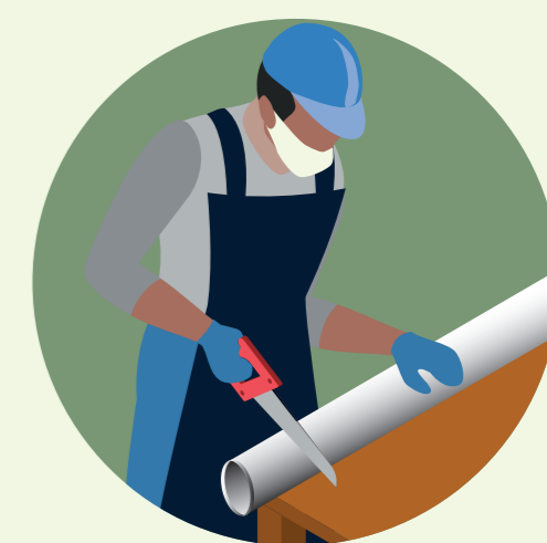
Indústria de PVC