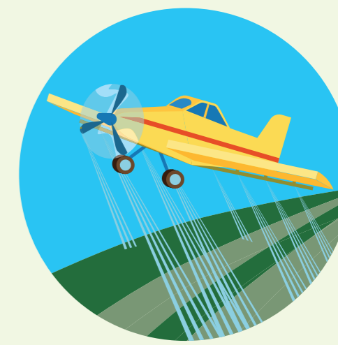
Aplicadores de agrotóxico