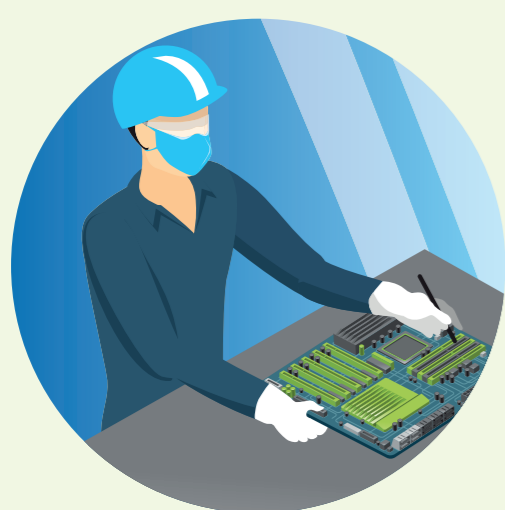
Indústria de eletrônicos