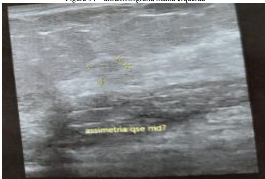
Figura 04 – ultrassonografia mama esquerda

Pela USG (figura 4) nódulo hipocóico, irregular, espiculado no QSL da mama esquerda, paralelo à pele e com vascularização periférica ao Doppler, medindo cerca de 1,8 x 1,7 x 1,1 cm, distando 0,9 cm da pele e 1,9 cm da papila. Mama direita sem lesões dignas de nota.