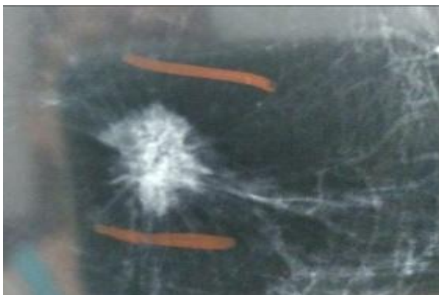
Figura 03 – spot mama esquerda