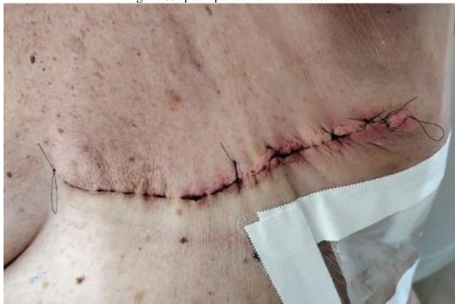
Figura 05: pós-operatório de mastectomia

Deliberada então a cirurgia, onde fora realizada mastectomia simples com biópsia de linfonodo sentinela axilar à esquerda com azul de metileno e congelamento de linfonodo sentinela negativo para malignidade. Procedimento aconteceu sem nenhuma intercorrência; paciente seguiu com dreno de hemovac, com inserção em prolongamento de axila esquerdo (Fig.5), retirado no oitavo dia de pós-operatório. Retirados pontos no 21º dia de pós-operatório.