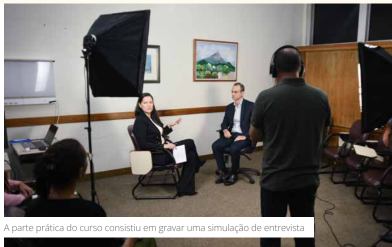
A parte prática do curso consistiu em gravar uma simulação de entrevista

“O treinamento foi bastante enriquecedor. Aprender com pessoas tão preparadas em como representar o Instituto