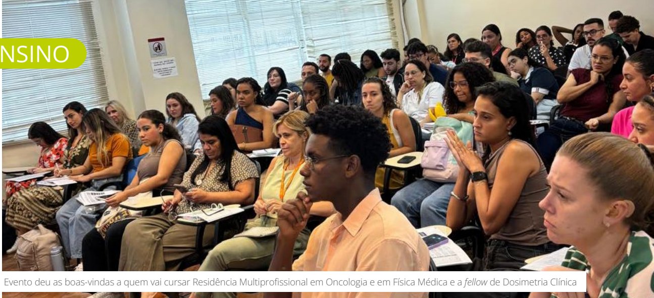
Evento deu as boas-vindas a quem vai cursar Residência Multiprofissional em Oncologia e em Física Médica e a fellow de Dosimetria Clínica