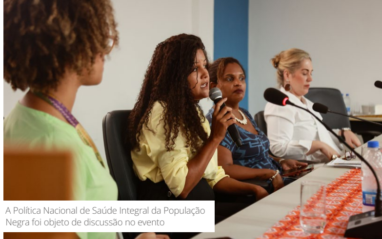
A Política Nacional de Saúde Integral da População Negra foi objeto de discussão no evento

O simpósio reuniu profissionais de saúde, pesquisadores, gestores e pacientes do Sistema Único de Saúde para