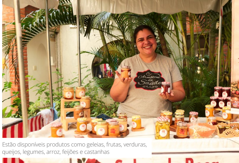
Estão disponíveis produtos como geleias, frutas, verduras, queijos, legumes, arroz, feijões e castanhas