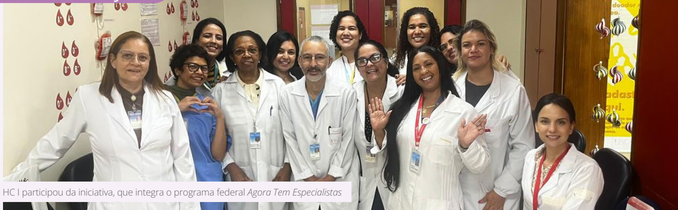
HC I participou da iniciativa, que integra o programa federal Agora Tem Especialistas