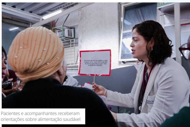
Pacientes e acompanhantes receberam orientações sobre alimentação saudável

da Vigilância Sanitária garantiu a segurança dos protocolos e o acesso ágil aos imunizantes.