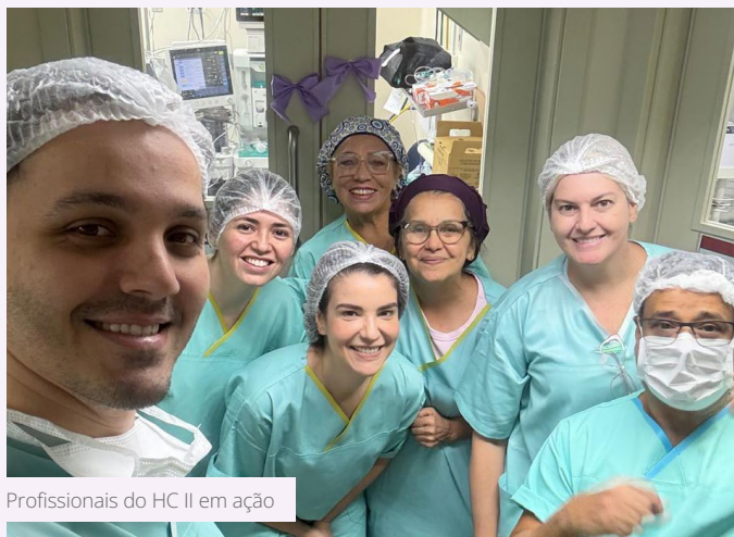
Profissionais do HC II em ação