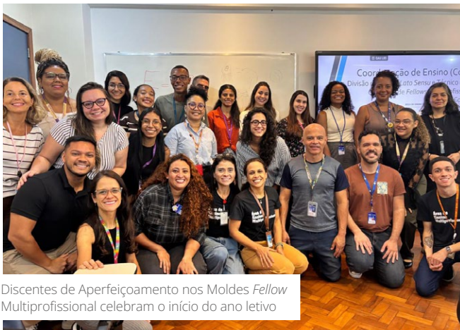
Discentes de Aperfeiçoamento nos Moldes Fellow Multiprofissional celebram o início do ano letivo