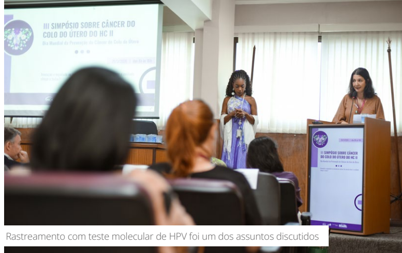
Rastreamento com teste molecular de HPV foi um dos assuntos discutidos

Entre os destaques, houve a discussão sobre a implementação do rastreamento organizado da doença com o teste molecular de HPV no Sistema Único de Saúde (SUS) e também a inclusão de protocolos inovadores para o tratamento.