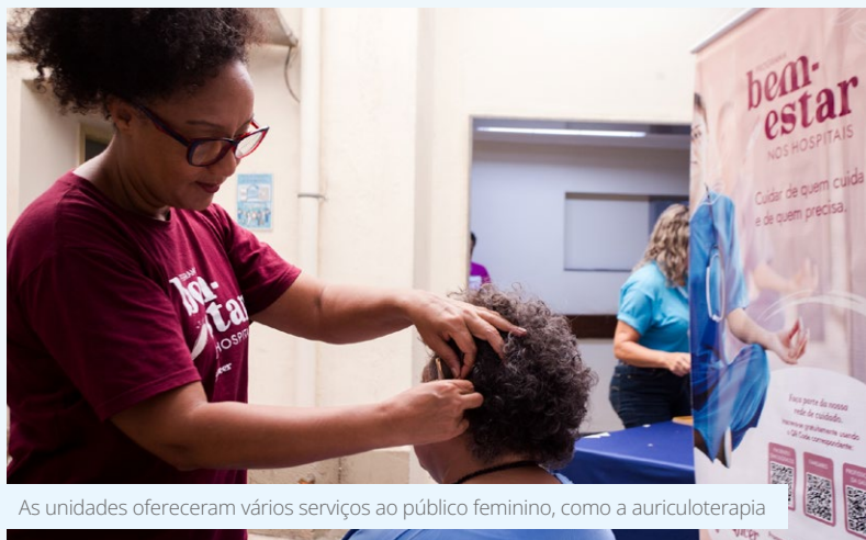
As unidades ofereceram vários serviços ao público feminino, como a auriculoterapia

A obra pretende reforçar a importância de ambientes de trabalho mais inclusivos, equitativos e respeitosos, fortalecendo as redes de apoio, o engajamento e a valorização contínua das profissionais. Além disso, o projeto contemplará a promoção de capacitação e atividades voltadas à prevenção de todo tipo de violência.