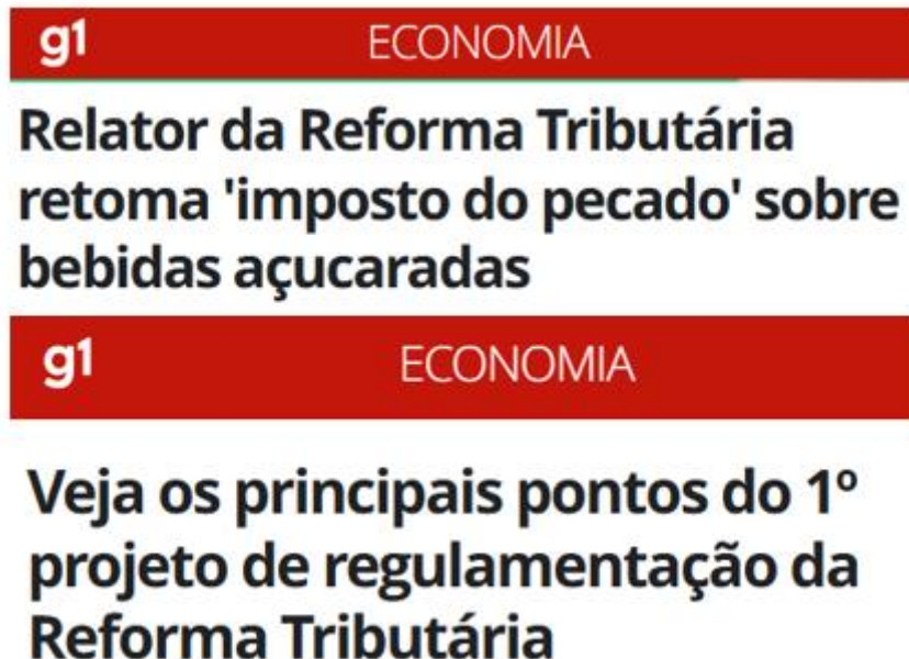
Figura 4 – Regulamentação da Reforma Tributária – imposto seletivo sobre bebidas açucaradas.