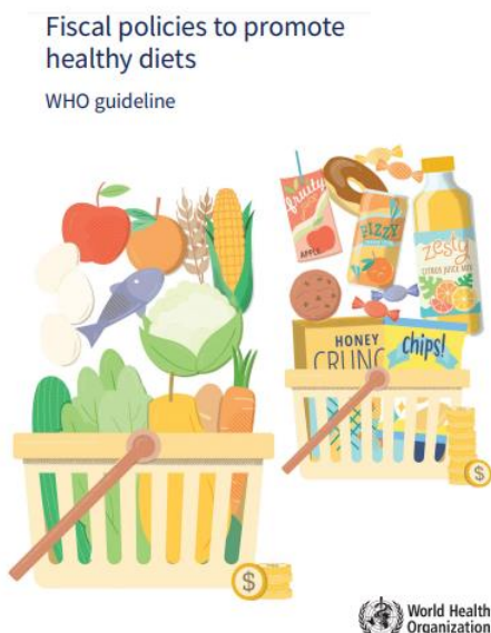
Figura 5 – WHO Guidelines - Fiscal policies to promote healthy diets