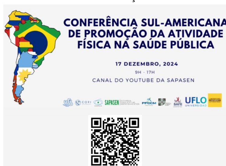
Figura 2 – Conferência Sul-Americana de Promoção da Atividade Física na Saúde Pública.

A Conferência foi organizada pela SAPASEN - South American Physical Activity and Sedentary Behavior Network , iniciativa que visa formar um corpo representativo de pesquisadores e formuladores de políticas de todos os países da América do Sul para estabelecer prioridades, metas e ações sobre atividade física e comportamento sedentário.