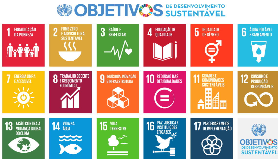
Figura 1. Objetivos de desenvolvimento sustentável, Nações Unidas, 2015 Fonte: Brasil, 2017 7 .

A Agenda 2030, construída a várias mãos desde a Rio +20, foi adotada por 193 Países-Membros das Nações Unidas, inclusive o Brasil, na Cúpula do Desenvolvimento Sustentável, em setembro de 2015. A Agenda 2030, criada para colocar o mundo em um caminho mais sustentável e resiliente, é uma Declaração composta por 17 ODS, tendo aproximadamente 169 metas, sugerindo meios de implementação e de parcerias globais, além de um roteiro para acompanhamento e revisão.