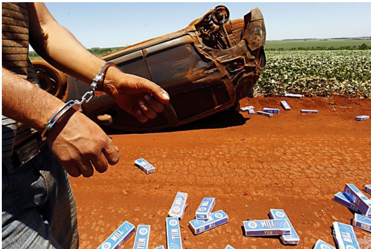
Figura 5 – Apreensão pela Polícia Federal de cigarros contrabandeados.

legislação atual já define como crimes a adulteração de produtos destinados a consumo ou a prestação de informações falsas sobre alimentos, produtos terapêuticos e medicamentos, mas não menciona os cigarros. Essa pena também será aplicada em casos de omissão ou disfarce de informação que devam constar da embalagem ou da propaganda de qualquer produto submetido à vigilância sanitária, como os derivados do tabaco.