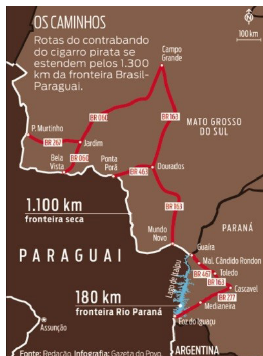
Figura 2 – Império das cinzas.

O restante da perda de arrecadação está relacionado ao contrabando proveniente dos países vizinhos, principalmente do Paraguai.