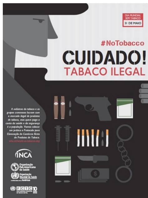
Figura 1 – Dia Mundial sem Tabaco 2015

Para o Dia Mundial sem Tabaco de 2015 (Figura 1), a OMS convocou os governos a trabalharem conjuntamente para eliminar o mercado ilegal dos produtos de tabaco, alertando sobre seu impacto negativo em saúde, legislação, economia, boas práticas de governança, além da sua relação com corrupção e crime organizado.