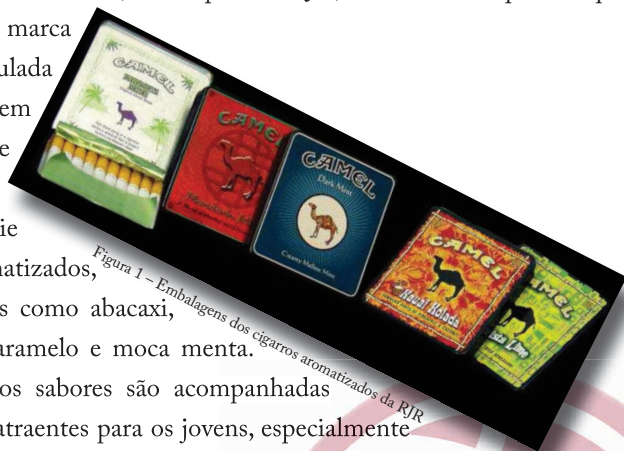
Figura 1 - Embalagens dos cigarros aromatizados da RJR

As estratégias dos sabores são acompanhadas por embalagens atraentes para os jovens, especialmente elaboradas para transmitir sensações agradáveis e a ideia de sabores diferenciados.