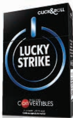
Figura 3 – Embalagem do cigarro cujo filtro “libera” o sabor

Por exemplo, a Souza Cruz (BAT) lançou recentemente o cigarro da marca Lucky Strike, com um novo design , adequado para aguçar a curiosidade e encorajar a experimentação: o filtro contém uma cápsula de mentol que, quando quebrada, libera subitamente o sabor. O ato de fumar se torna então mais dinâmico, pelo convite do slogan de promoção da marca, “ click to change the taste! ” (clique para alterar o sabor), exibido ao lado dos produtos nos pontos de venda.