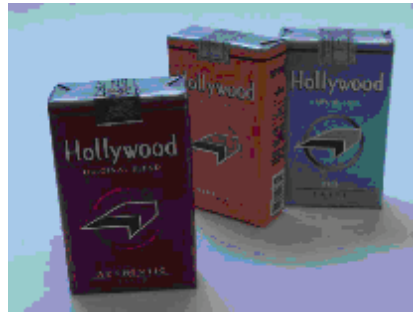
Figura 5 – Embalagem dos cigarros Hollywood “Sabor sem Fronteiras”

A marca Hollywood, uma das mais vendidas no Brasil, também foi diversificada pelo conceito “Sabor sem Fronteiras”, vinculado a peças de propaganda dirigida a adolescentes. Essa linha inclui as versões Turkish Blend , Australian Blend , American Blend , Caribbean Blend , Original Blend e Alps Ice Blend .