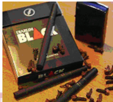
Figura 6 – Embalagem do cigarro Djarum Black, sabor cravo

Outra marca, recentemente lançada no Brasil, com sabor de cravo, é o Djarum Black , da indústria tabageira Golden Leaf Tobacco Ltda., que foi amplamente divulgada em uma novela de grande audiência, sendo utilizada pela atriz protagonista Aline Moraes.