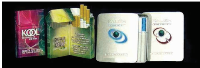
Figura 2 – Embalagens dos cigarros aromatizados Kool

Seguindo essa mesma estratégia, a Brown & Williamson, outra companhia de tabaco, introduziu várias versões aromatizadas da sua marca Kool, uma delas com o sabor de nome Moca , Morango da Meia-Noite ( Midnight Berry ). 74