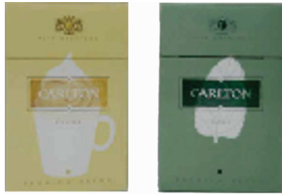
Figura 4 – Embalagem do cigarro Carlton, com sabores

Ainda no Brasil, o fabricante da marca Carlton diversificou seu portfólio ao criar os sabores da linha Carlton Flavours , que inclui as versões Mint , Crema e Cappuccino , sempre acompanhadas de cuidadosas elaborações das embalagens para atrair consumidores pela ideia do prazer de degustar sabores diferenciados.