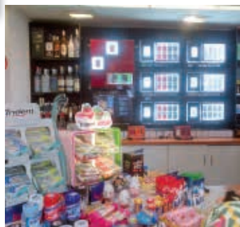
Figura 13 - Ponto de venda com exposição destacada dos maços em loja de conveniência no Brasil