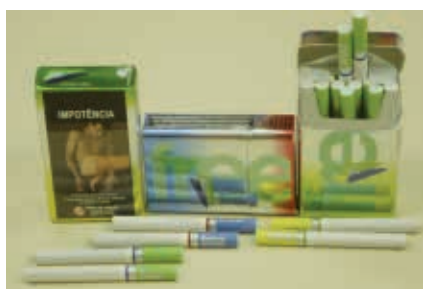
Figura 9 - Cigarros da marca Free de filtros coloridos em embalagens metálicas coloridas em tons néons

As figuras a seguir (9, 10, 11, 12, 13, 14, 15) ilustram as inovações nas embalagens de cigarros e seu posicionamento em pontos de venda no Brasil.