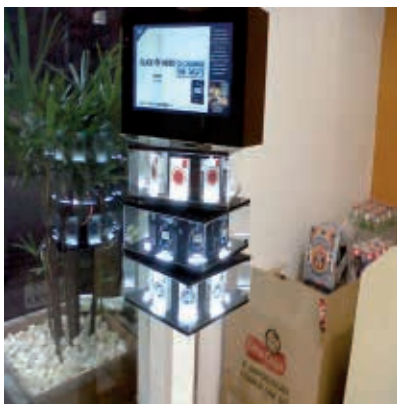
Figura 11 - Expositores de embalagens como forma de propaganda de cigarros no Brasil