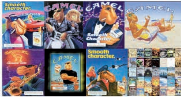
Figura 5 – Embalagens e propagandas da marca Camel com o personagem Joe Camel

aproximadamente a mesma proporção de crianças que era capaz de relacionar o personagem Mickey Mouse com o logotipo do Disney Channel. A Figura 5 52 mostra vários exemplos de propagandas utilizadas para promover a marca Camel, nas quais as embalagens aparecem ao lado do personagem Joe Camel em diferentes situações desejadas pelos jovens.