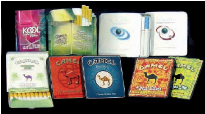
Figura 3 - Exemplo de embalagens de cigarros direcionadas para jovens.

XIX. Entre inúmeras pesquisas realizadas pela indústria do tabaco, há como exemplo o relatório de marketing da Philip Morris demonstrando a preocupação com a percepção dos consumidores, sobretudo jovens, das embalagens como antigas ou fora de moda (Figura 3). “Quando expostos às inovações, sobretudo os jovens adultos percebem suas embalagens atuais como embalagens superadas e entediantes”. O documento observa que o valor da novidade em embalagens é que “traz atenção e inveja de outros [consumidores] e que [...] especialmente consumidores jovens adultos estão prontos para mudar de embalagens” 49 .