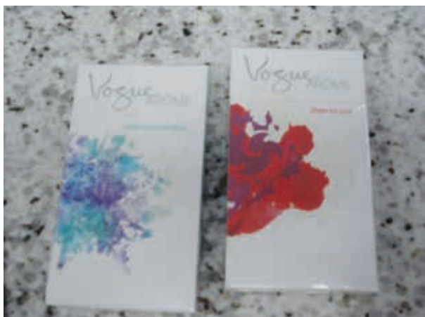
Figura 4 - Exemplo de embalagem de cigarro voltada para o público feminino

Da mesma forma, há pesquisas desenvolvendo embalagens para mulheres, gerando maços em formato slim , long packs , traduzindo a associação entre fumar e uma silhueta esbelta, e em tons de cores e ilustrações que promovem uma percepção de sofisticação e feminilidade (figura 4). Um relatório de pesquisa da Philip Morris observa que “algumas mulheres admitem comprar Virginia Slims, Benson and Hedges etc. quando elas saem à noite, para complementar um desejo de parecerem mais femininas e com estilo” 51 .