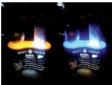
Figura 12 - Publicidade com alternância de cor na iluminação do Free iSwitch no Rio de Janeiro, 2013