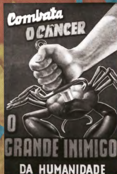
• Cartazes elaborados pela Liga Bahiana contra o câncer, década de 1950.