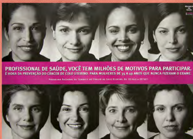
Cartazes do Programa Viva Mulher, década de 1990.

In September 1998, the Ministry of Health took over the project's control and launched a national campaign named “Intensification Phase”.