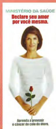
Cartaz do Programa Viva Mulher, ano 2000.

In 2002, the Second National Campaign of Viva Mulher Program was launched.