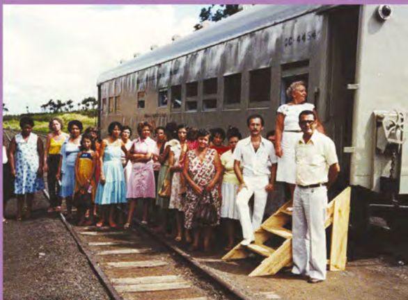
• Trem adaptado para realização de consultas e exames preventivos, década de 1970.

Em São Paulo, com o apoio do governo do estado, a Fundação Centro de Pesquisa em Oncologia (FCPO) e o Instituto Brasileiro do Controle do Câncer (IBCC) implantaram um Programa Estadual de Prevenção e Controle do Câncer. Unidades móveis (ônibus e vagões de trem) foram equipadas para realizar consultas e exames preventivos.