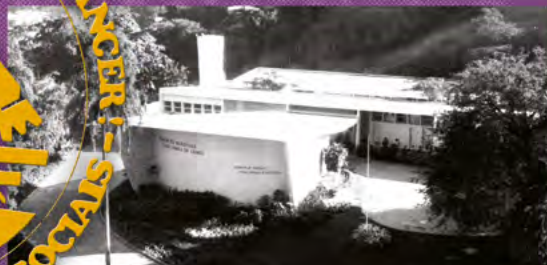
• Prédio do Centro de Pesquisas Luiza Gomes de Lemos, década de 1970.