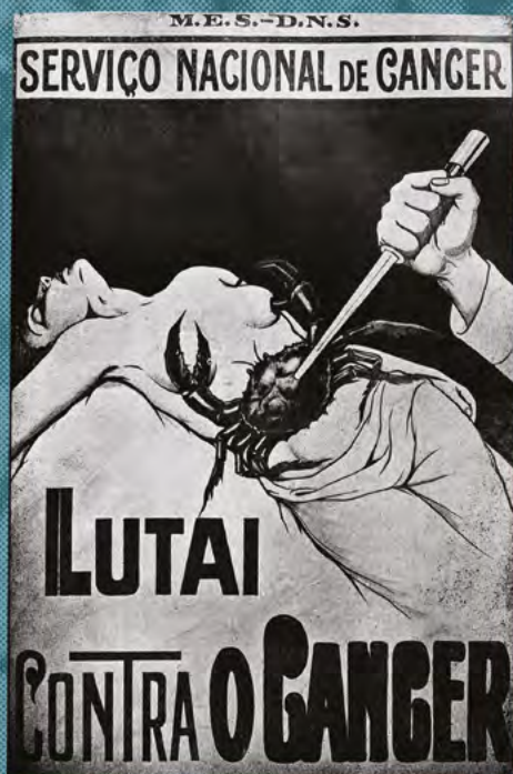
Cartazes educativos do Serviço Nacional do Câncer, década de 1940. Arquivo Genilda Kneiff.