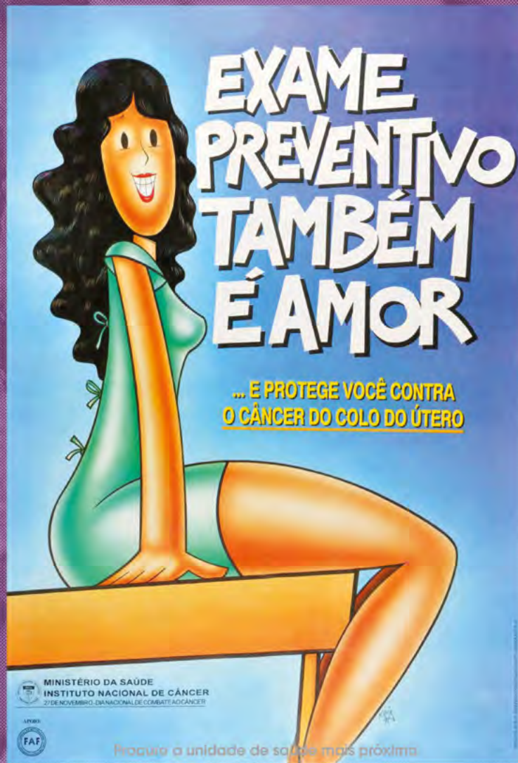
Cartaz do dia Nacional de Combate ao Câncer de 1994, elaborado pelo Pro-Onco.