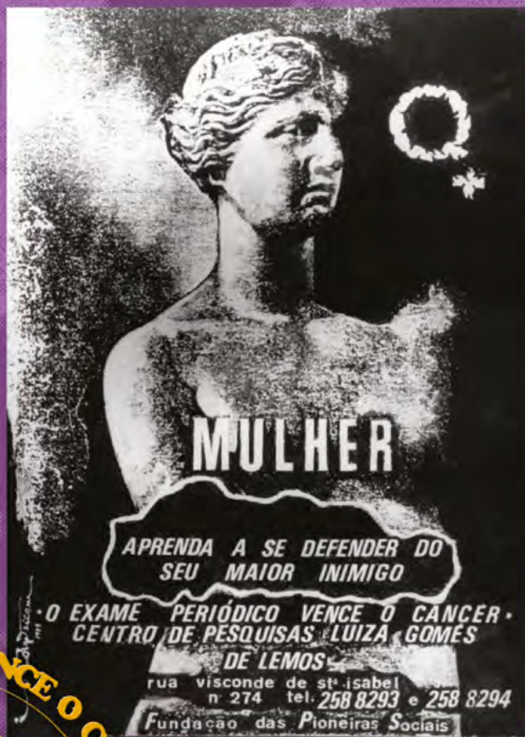
• Cartaz do Centro de Pesquisas Luiza Gomes de Lemos, década de 1970.

The Centre had gynecological consultation rooms, cytopathology and histopathology laboratories, and a fleet of mobile units to carry out gynecological exams in several places in the state.