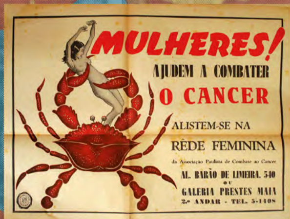
• Cartaz elaborado pela Associação Paulista de Combate ao câncer, década de 1940.