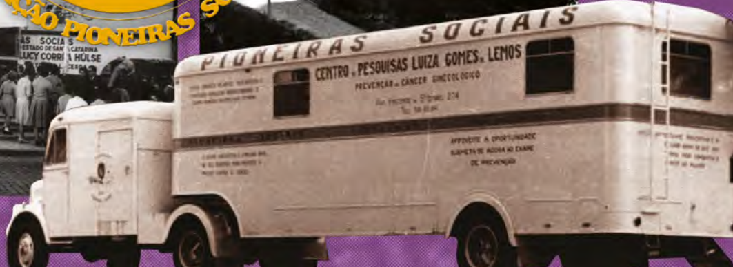
• Unidade volante do Centro de Pesquisas Luiza Gomes de Lemos - Pioneiras Sociais, década de 1970.