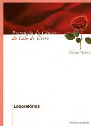
Capa da publicação “Manual Técnico: Laboratórios”, 2002