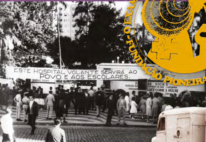
• Campanha de prevenção do câncer realizada pela Fundação das Pioneiras Sociais, 1975