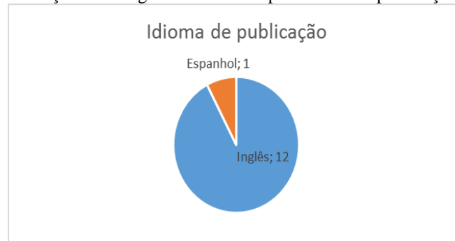
Gráfico 4. Distribuição dos artigos selecionados por idioma de publicação.

Dentre as publicações selecionadas, percebeu-se que nenhuma destas estava em português e apenas uma destas tinha o Brasil como país de filiação. O pequeno número de publicações sobre o tema no Brasil, encontrado na base BVS, sugere a necessidade de confirmação em outras bases de dados.