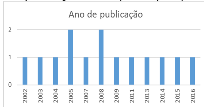
Gráfico 1. Distribuição dos artigos selecionados por ano de publicação.

Quanto ao tipo de publicação (Gráfico 2), 08 (oito) dos textos encontrados são artigos originais de pesquisa, somados a 02 (dois) pôsteres de evento, 01 (uma) reflexão teórica, 01 (uma) revisão sistemática e 01 (um) editorial.