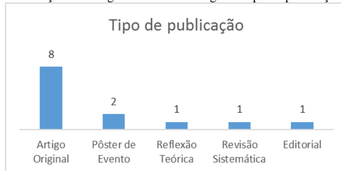
Gráfico 2. Distribuição dos artigos selecionados segundo tipo de publicação.

Ao avaliarmos o país de filiação dos autores (Gráfico 3), 11 (onze) são dos Estados Unidos da América, 01 (um) da Espanha e 01 (um) do Brasil.