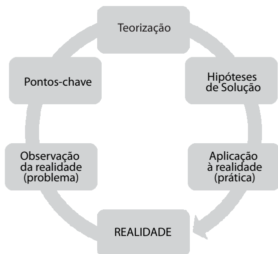
Figura 2 – Esquema da coleta de dados.