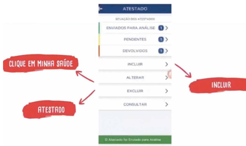
Registro da documentação ficou mais ágil com a ferramenta Atestado Web

No atestado do servidor devem constar nome, assinatura e número de registro do profissional que o emitiu, além do Código da Classificação Internacional de Doenças (CID) ou diagnóstico e o período recomendado de afastamento.