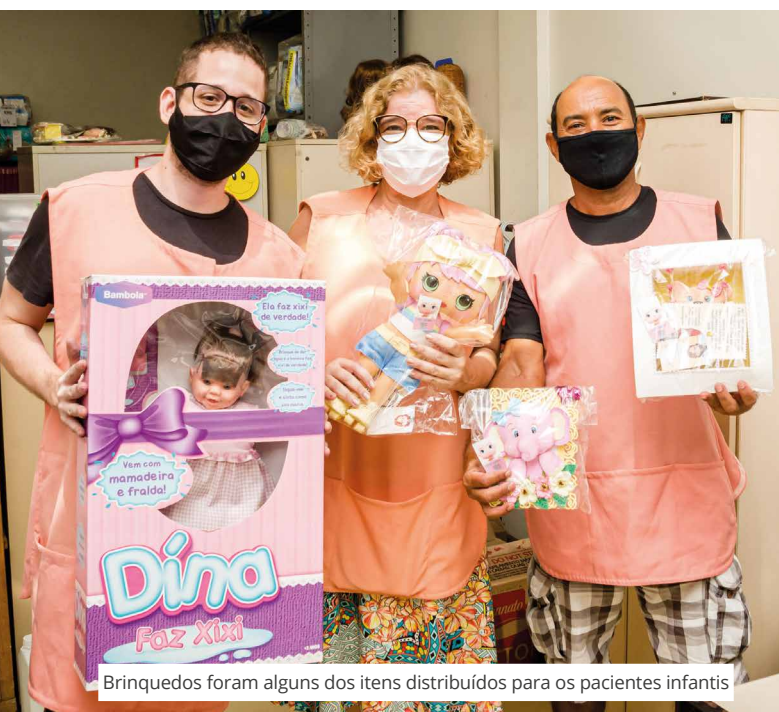
Brinquedos foram alguns dos itens distribuídos para os pacientes infantis

Para 2021, está prevista doação de brinquedos para os pacientes infantis em datas comemorativas feita em parceria com a rede de lojas de brinquedos RiHappy.