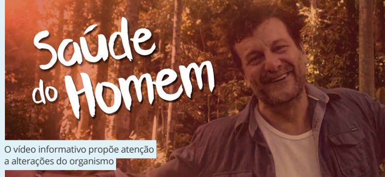
O vídeo informativo propõe atenção a alterações do organismo

Recentemente, o MS lançou, com apoio técnico do INCA, a página Câncer de próstata; causa, sintomas, tratamento e prevenção , em seu portal na Internet. O INCA também publicou a cartilha Câncer de próstata: vamos falar sobre isso? , com informações que tiram dúvidas acerca da doença e incentivam a conversa com o profissional de saúde. Além