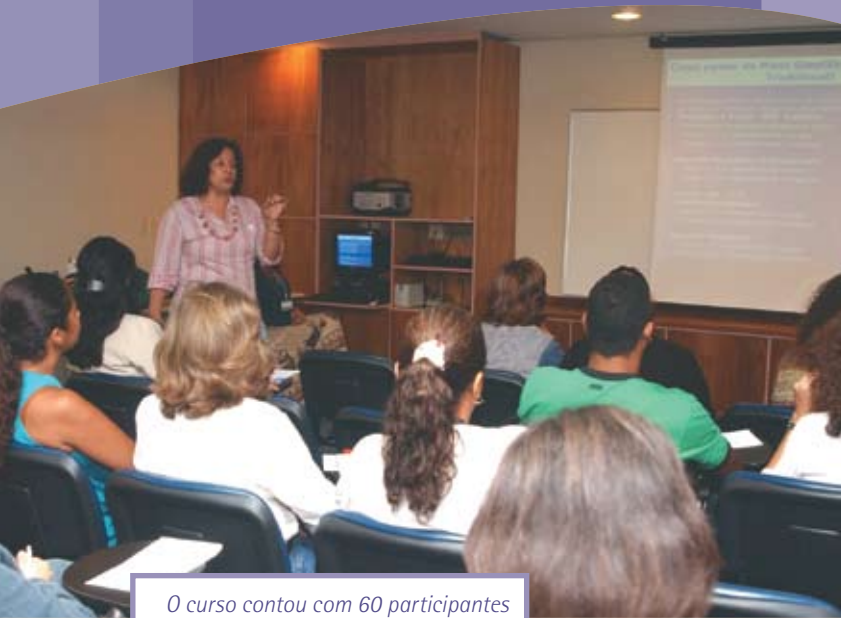
O curso contou com 60 participantes