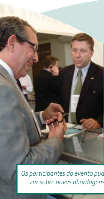
Os participantes do evento puderam se atualizar sobre novas abordagens no tratamento