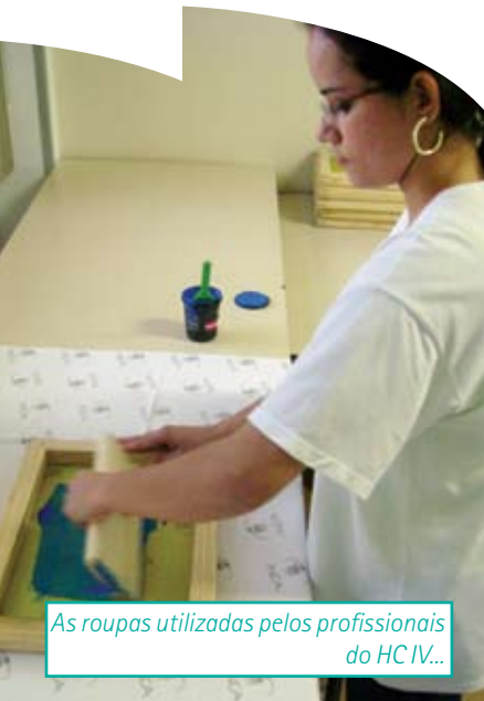
As roupas utilizadas pelos profissionais do HC IV...