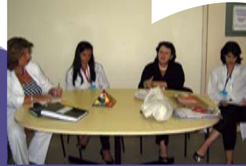
Na inauguração, foram ouvidos depoimentos sobre dificuldades na cessação do tabagismo

O evento aconteceu no auditório Vinho, onde os participantes da primeira turma puderam dar depoimentos e falar sobre as dificuldades e a vontade de parar de fumar. Durante o tratamento, realizado em grupo, os profissionais falam sobre saúde e tabagismo, relatam experiências de sucesso de pessoas que pararam de fumar e os benefícios de ser ex-fumante. Exemplos disso são melhorias no olfato e paladar; o aumento da disposição física; e melhoria na oxigenação do corpo. Para os pacientes, ressalta-se que os efeitos colaterais da quimioterapia e radioterapia diminuem se a pessoa parar de fumar.